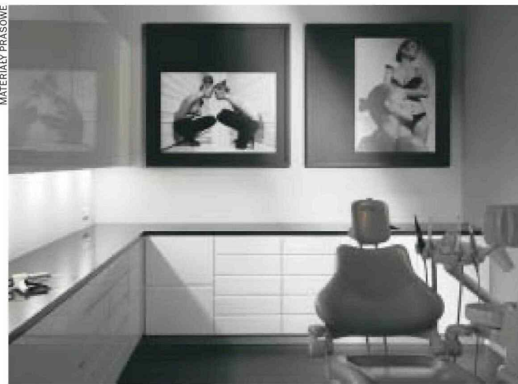
Jak twierdzą twórcy placówki Den Arte, gabinet powstał, żeby poruszać zmysły...

Jury doceniła trójmiejskie projekty. Den Arte z Sopotu dostał wyróżnienie za wprowadzenie sztuki w przestrzeń gabinetu. A wyróżnienie w ka-