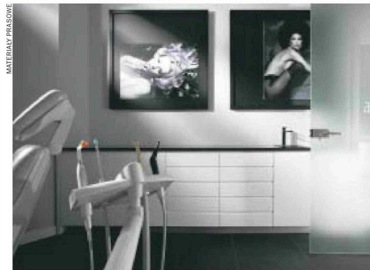
...ta idea znalazła odzwierciedlenie w wystroju, które klimatem nawiązuje do nowoczesnych wnętrz galerii sztuki...

Top Design Gabinetów Stomatologicznych to konkurs organizowany wspólnie przez firmę działającą w branży dentystrycznej - Dental Depot Wasio - oraz miesięcznik „Dobre Wnętrze” pod patronatem Naczelnej Izby Lekarskiej. ●